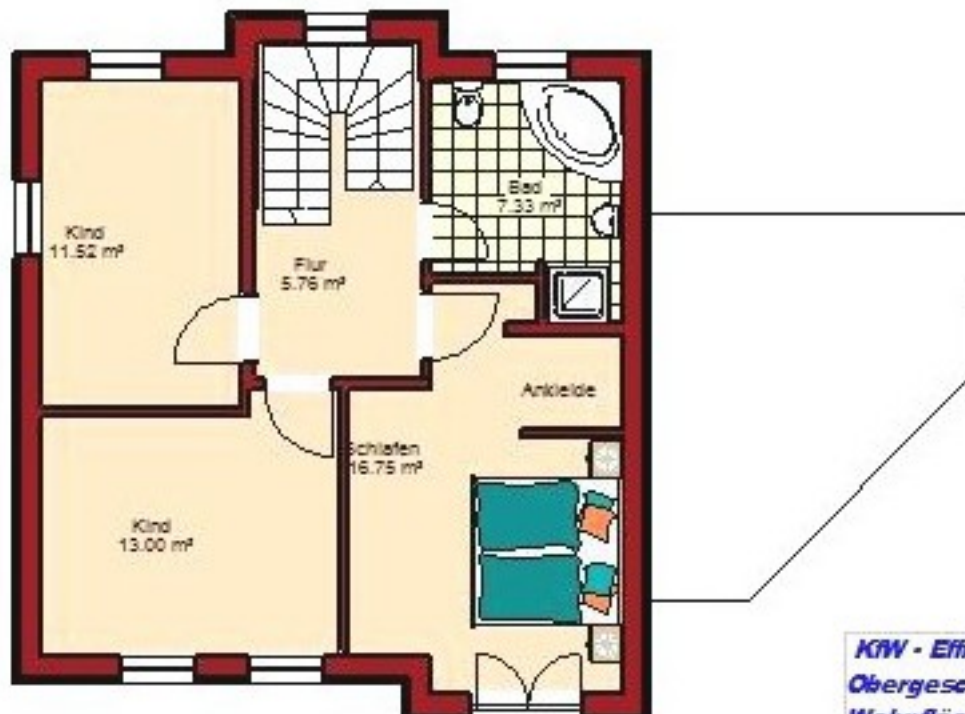
KW - Effizienzhaus 70 Obergeschoss Wohnfläche 54,36 qm